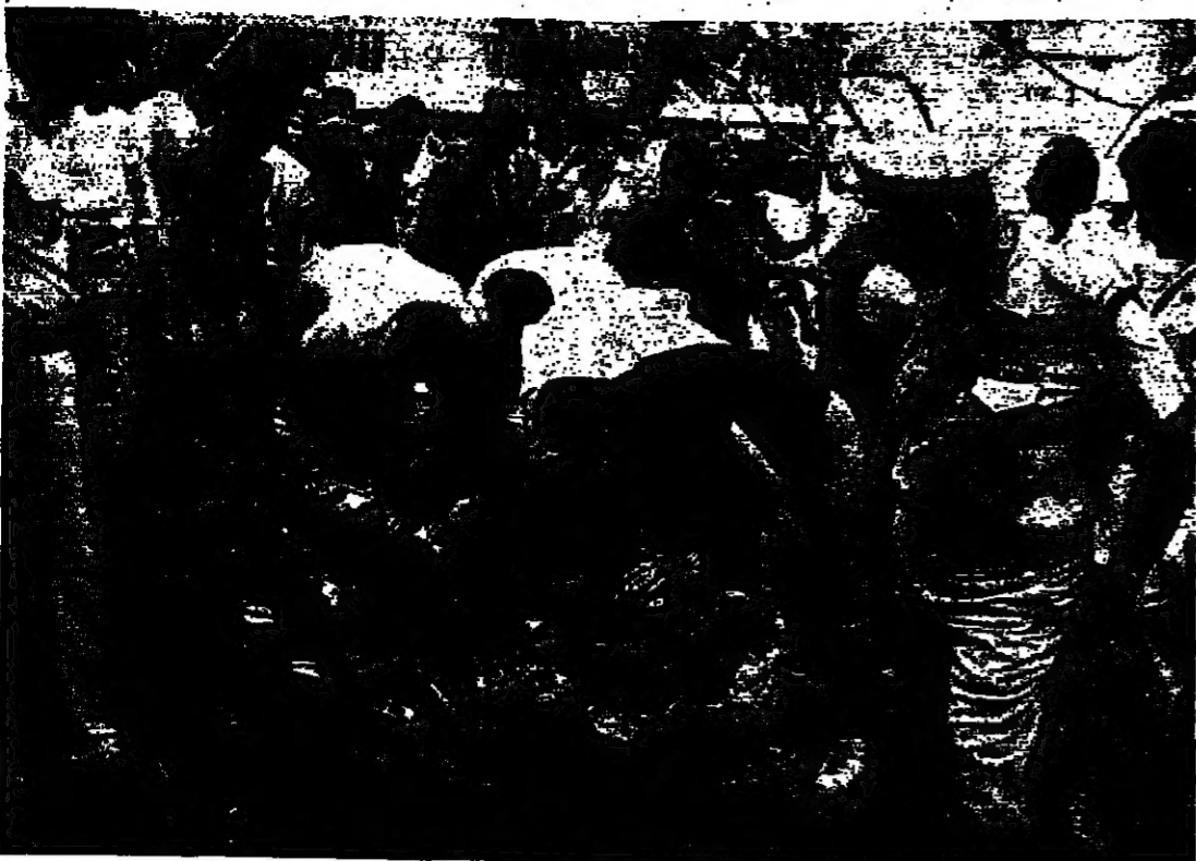
انفجار سيارة ملغومة قرب مكتب للحزب الاشتراكي في الغربية